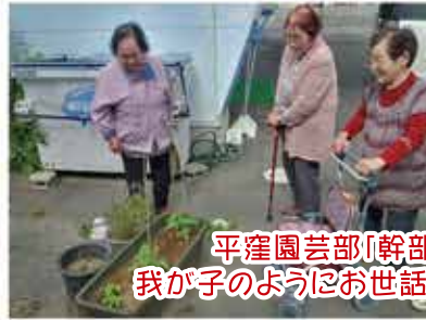
平窪園芸部「幹部」のみなさん♪ 我が子のようにお世話して下さっています！