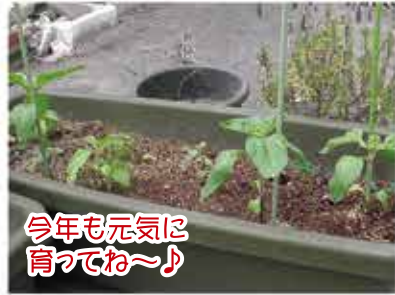
今年も元気に育つてね〜♪

平窪園芸部「幹部」の皆さんを筆頭に我々スタッフも水やり・手入れに余念がありません。このひまわり達のようにレッツ倶楽部いわきも、昨年より大きく成長できるよう日々頑張っていきたいですね。