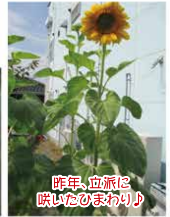
昨年、立派に咲いたひまわり♪